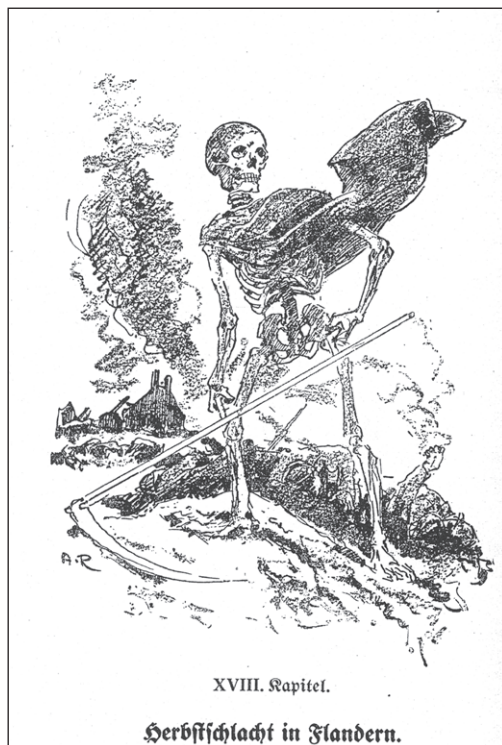
Ilustr. 11. Strona tytułowa XVIII rozdziału z monografii 9. Pułku Grenadierów obrazująca krwawą walkę jesienią 1917 r. we Flandrii. Fot. za: J. Hansch, F. Weidling, Das Colbergsche Grenadier-Regiment Graf Gneisenau (2. Pommersches) Nr. 9 im Weltkriege 1914 – 1918, Berlin 1929.