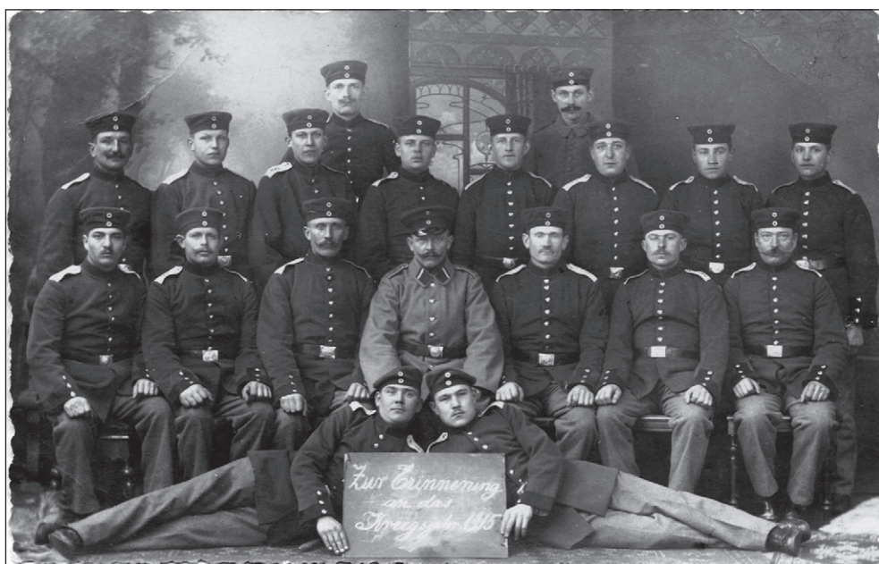
Ilustr. 10. Pamiątkowa fotografia z 1915 r. żołnierzy 9. Pułku Grenadierów