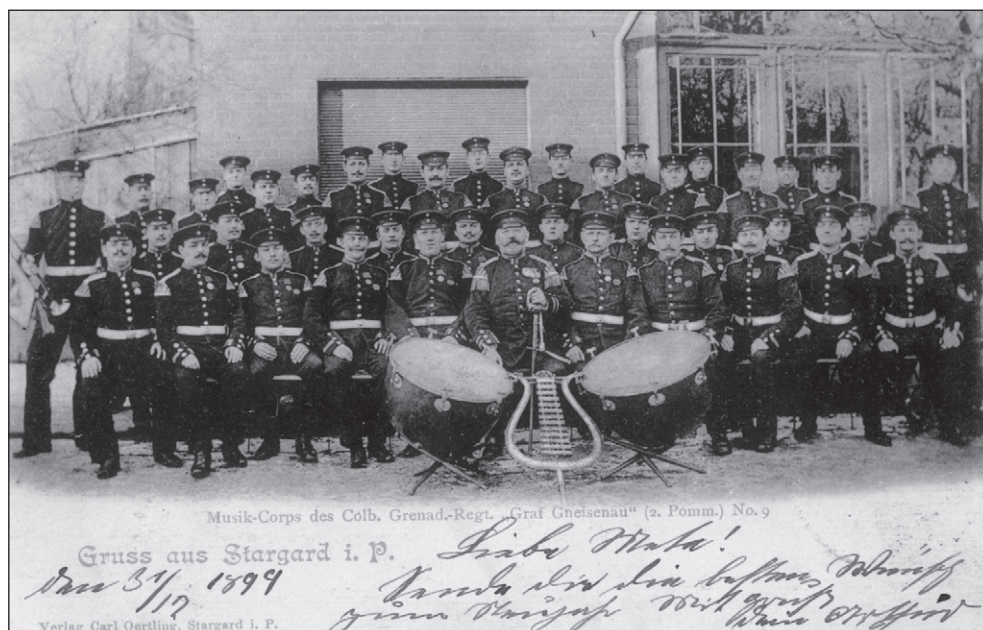
Ilustr. 1. Orkiestra garnizonowa 9. Kołobrzeskiego Pułku Grenadierów, koniec XIX w. (kartka pocztowa ze zbiorów autora)