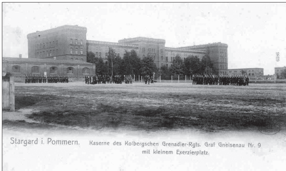
Ilustr. 4. Mały plac ćwiczeń ( Kleine Exerzierplatz ) 9. Pułku Grenadierów, i Czerwone Koszary, około 1910 r.