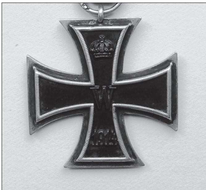
Ilustr. 7. Krzyż Żelazny ( Eiserne Kreuz ) z datą: 1914. (zbiory Muzeum w Stargardzie)