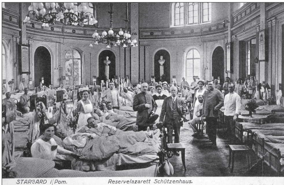
Ilustr. 8. Wnętrze lazaretu rezerwowego w domu Bractwa Kurkowego (Reservelazarett Schützenhaus), około 1916 r. (kartka pocztowa ze zbiorów Muzeum w Stargardzie)