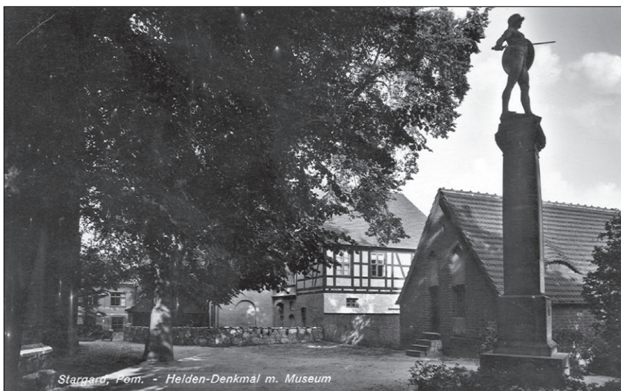
Ilustr. 12. Pomnik upamiętniający poległych żołnierzy i oficerów z 9. Kołobrzeskiego Pułku Grenadierów, odsłonięty w 1924 r. (zbiory Muzeum w Stargardzie)