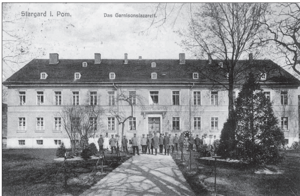
Ilustr. 3. Standort-Lazarett – szpital garnizonowy w Stargardzie, lata 1914 – 1918 (kartka pocztowa)